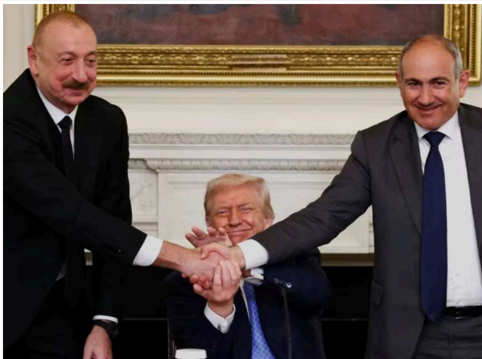
Від ворожнечі до "найкращих друзів": Стів Віткофф розкрив деталі примирення Алієва та Пашиняна за посередництва Трампа

Спеціальний посланник президента США Стів Віткофф заявив, що прем'єр-міністр Вірменії Нікол Пашинян і президент Азербайджану Ільхам Алієв стали «найкращими друзями» після 37 років конфлікту.