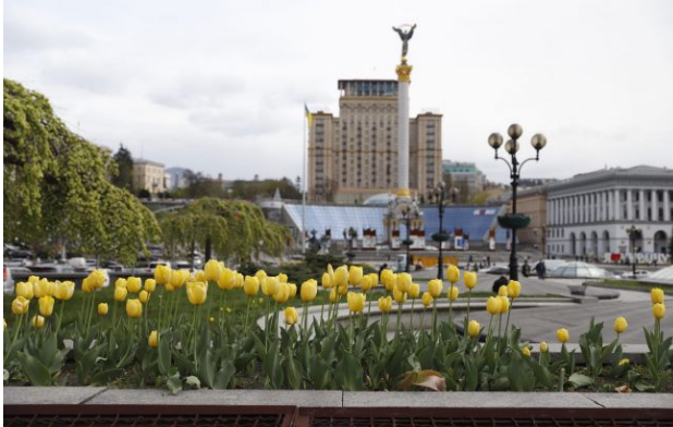
Фото: У Києві починають квітнути тюльпани (Віта Олексичин)

У Києві розпочався сезон цвітіння тюльпанів - у місті вже з'являються перші квіти, а найближчим часом очікується масове цвітіння. Частина цибулин столиця отримала у подарунок від нідерландських компаній.