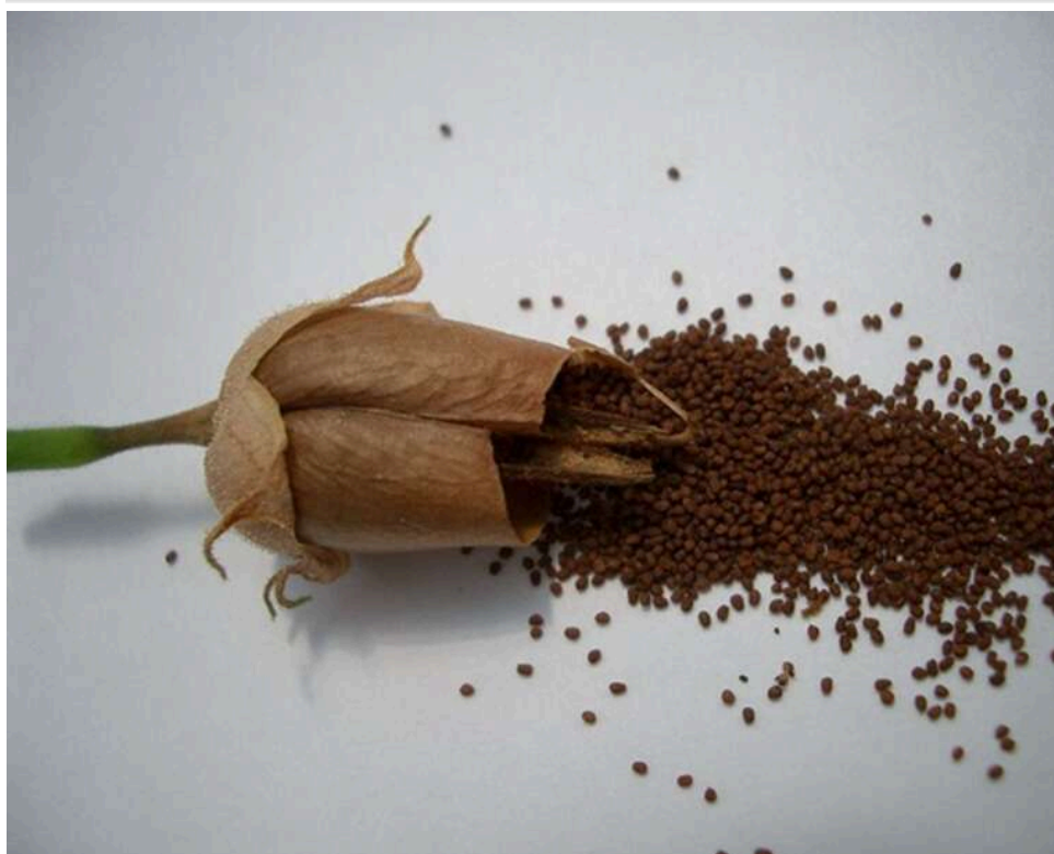
«Тютюновий пояс» на 230 тисяч: на Закарпатті судили жінку, яка намагалася пронести елітне насіння під одягом