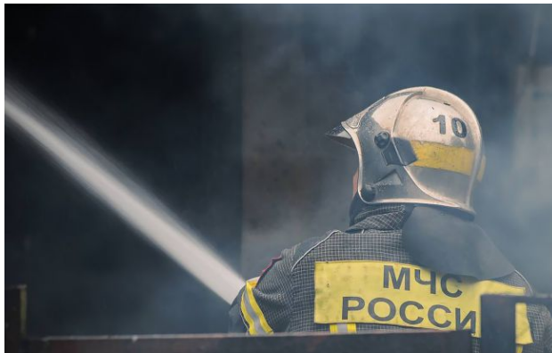
Фото: працівники російської МЧС

В РФ вночі невідомі дрони атакували одразу два об'єкти - Новокуйбишевський НПЗ, що в Самарській області та НПС "Горький", що знаходиться в Нижегородській області.