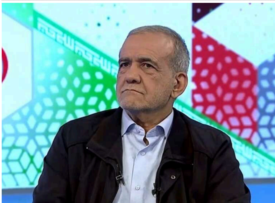
Три перешкоди для діалогу: Президент Ірану назвав умови для початку «справжніх переговорів» із США