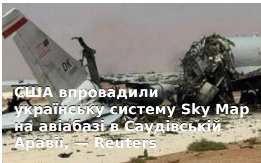
США впровадили українську систему Sky Map на авіабазі в Саудівській Аравії, — Reuters