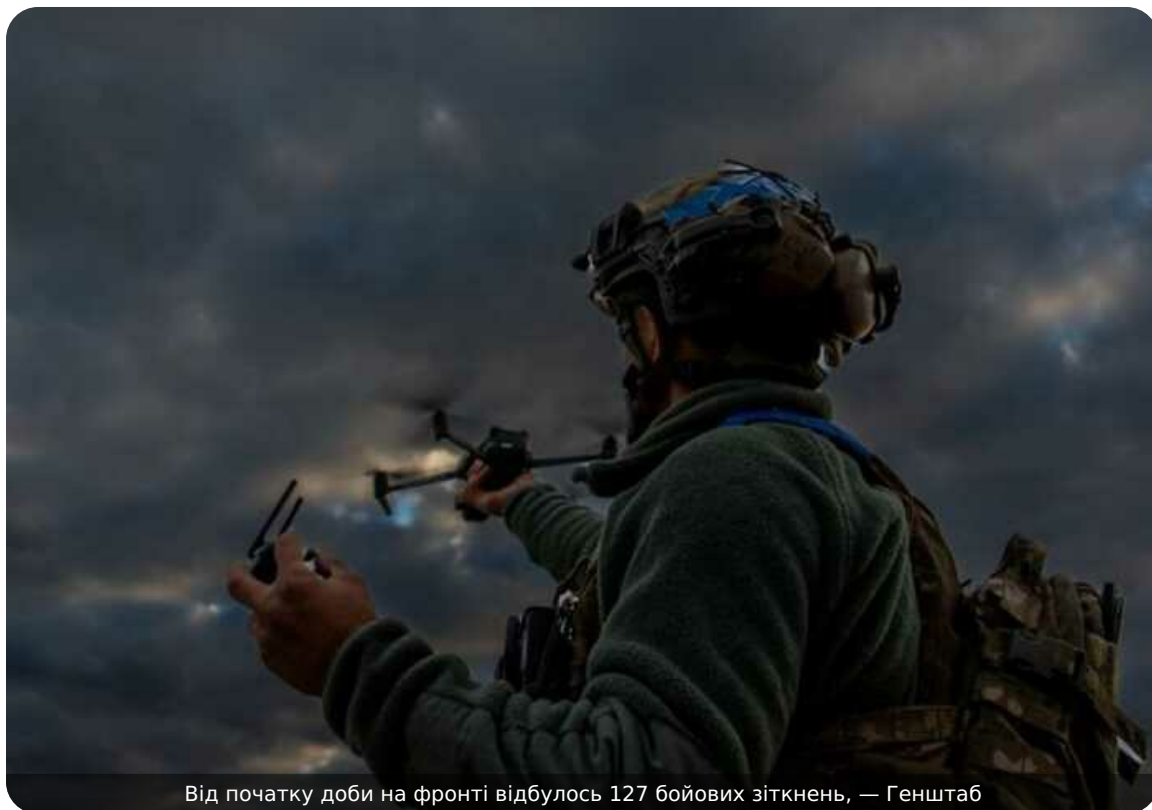
Від початку доби на фронті відбулось 127 бойових зіткнень, — Генштаб