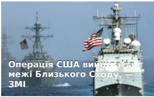
Операція США вийшла за межі Близького Сходу, — ЗМІ