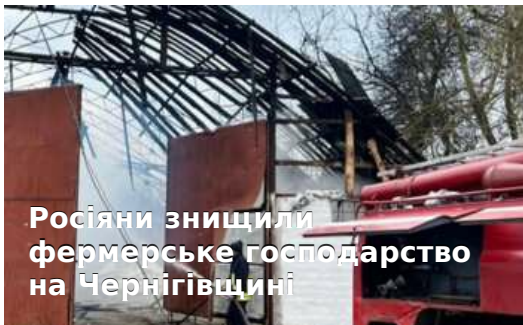
Росіяни знищили фермерське господарство на Чернігівщині