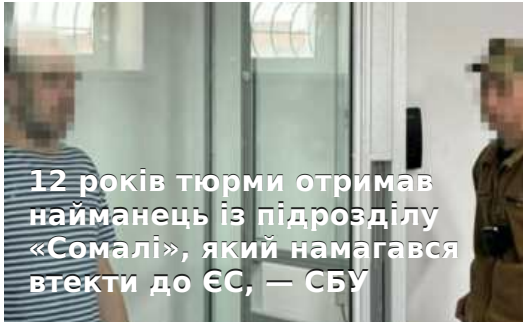
12 років тюрми отримав найманець із підрозділу «Сомалі», який намагався втекти до ЄС, — СБУ