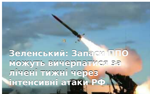
Зеленський: Запаси ППО можуть вичерпатися за лічені тижні через інтенсивні атаки РФ