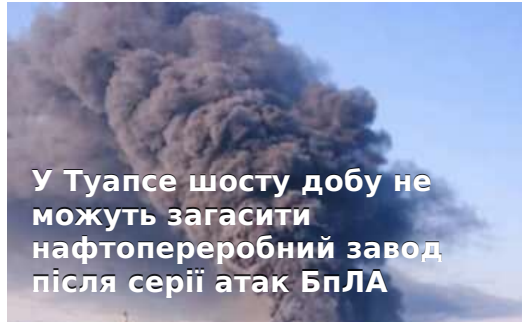
У Туапсе шосту добу не можуть загасити нафтопереробний завод після серії атак БПЛА