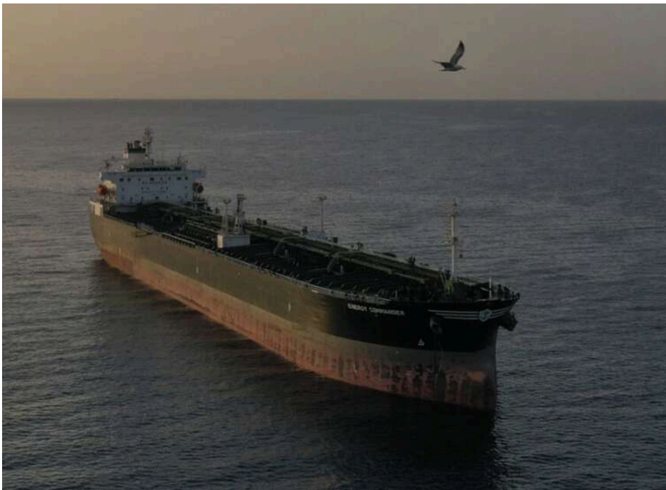
Ультиматум Галібафа: Іран відкриє Ормузьку протоку лише після зняття морської блокади США

Продовження перемир'я та відкриття Ормузької протоки стануть можливими лише після зняття морської блокади Ірану з боку США.