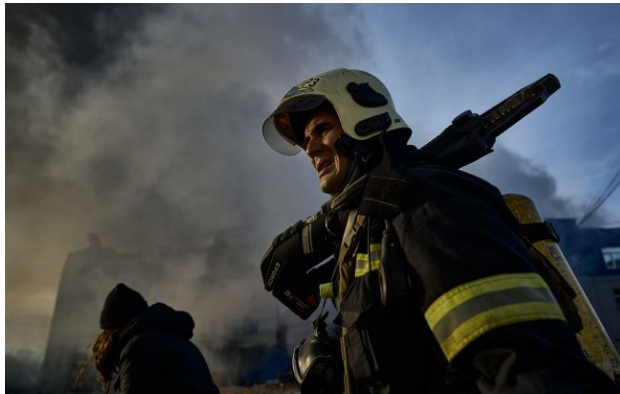
Фото: росіяни масовано атакували Богодухів дронами

За останні чотири доби Богодухівська громада Харківської області зазнала масованих атак, під час яких ворог випустив 110 дронів, спричинивши масштабні руйнування житлового сектору та інфраструктури.