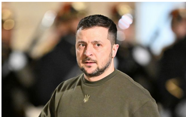
Фото: Володимир Зеленський (Getty Images)

Президент України Володимир Зеленський прокоментував чутки щодо перейменування Донбасу на "Донніленд". За його словами, головне, щоб регіон не став "Путінлендом".