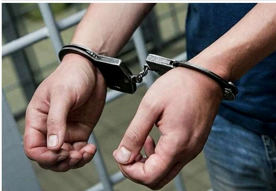
Київський суд засудив чоловіка до довічного ув'язнення за злочини проти малолітньої падчерки

Солом'янський районний суд міста Києва виніс вирок у резонансній справі про сексуальне насильство над дитиною. 07 квітня 2026 року колегія суддів визнала киянина винним у систематичному розбещенні та зґвалтуванні своєї малолітньої падчерки, з якою проживав разом з 2011 року.