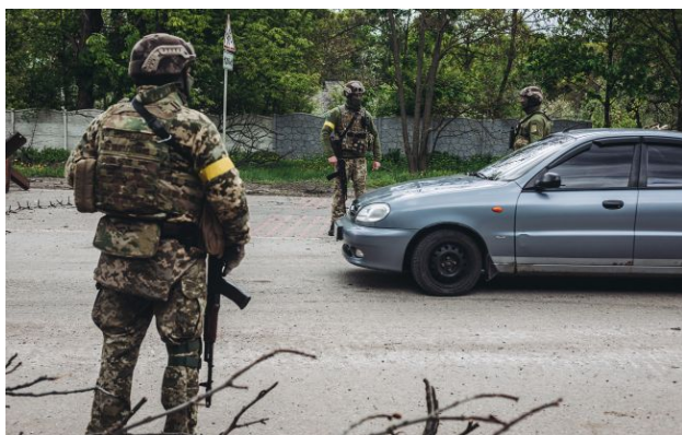
Військові на блокпості в Україні

У Києві та інших містах останнім часом стало більше блокпостів, і водіям частіше доводиться спілкуватися з поліцією і ТЦК. Хто має право зупиняти авто, які документи обов'язкові й чи можуть представники ТЦК силоміць витягати водія з авто?