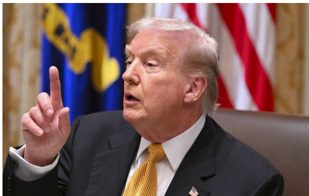
Фото: президент США Дональд Трамп (Getty Images)

Агресивна політика президента США Дональда Трампа щодо депортації мігрантів може негативно вплинути на позиції Республіканської партії на проміжних виборах до Конгресу в листопаді.