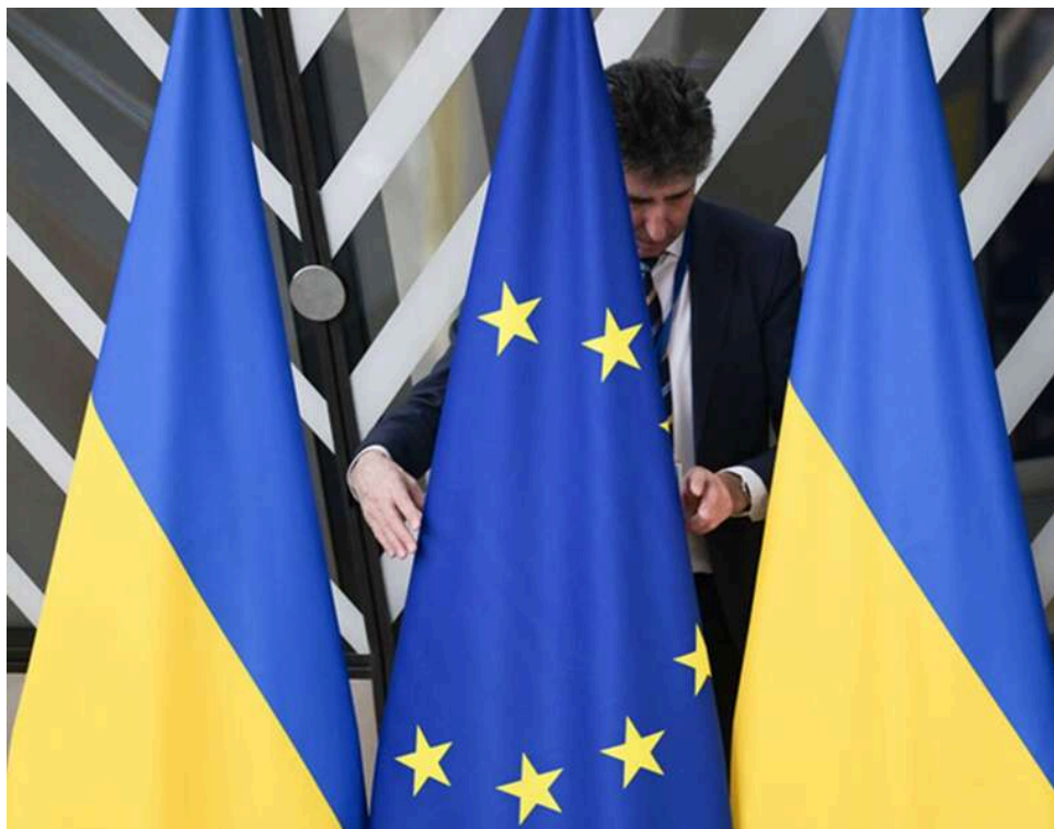
У ЄС погодили 20-й пакет санкцій проти РФ та виділення 90 мільярдів євро допомоги Україні

Посли країн Євросоюзу розпочали письмову процедуру схвалення кредиту на 90 млрд євро для України та 20-го пакету санкцій ЄС проти Росії, яка триватиме до 23 квітня.