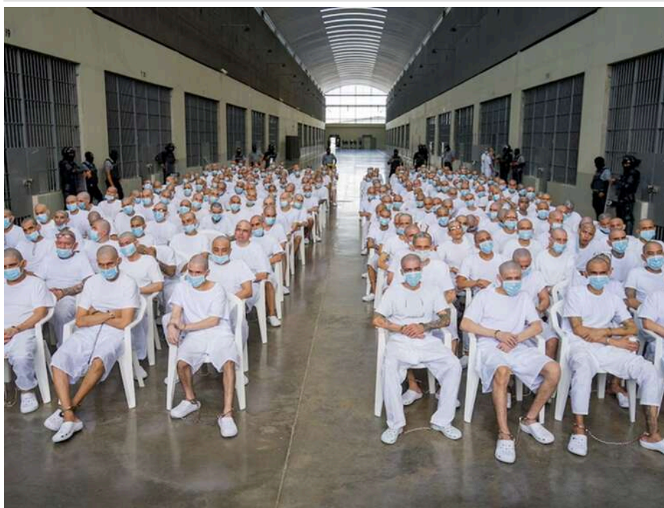
Інкримінують 47 тисяч злочинів: у Сальвадорі розпочався масовий суд над 486 членами банди

У Сальвадорі стартував масштабний судовий процес над 486 підозрюваними членами банди Mara Salvatrucha (MS-13). Їм інкримінують понад 47 000 злочинів, скоєних з 2012 по 2022 рік, зокрема вбивства, рекет і незаконну торгівлю зброєю.