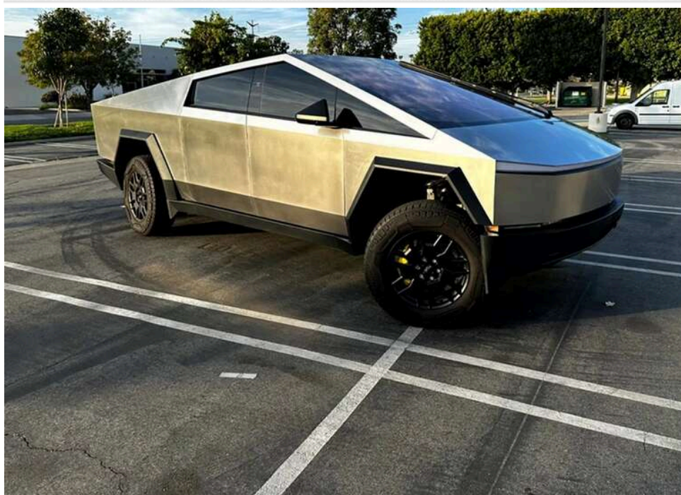
Не легковий автомобіль, а вантажівка: Суд оштрафував директора компанії на пів мільйона за неправильне розмитнення Tesla Cybertruck

Tesla Cybertruck – це не легковий автомобіль, а вантажівка: директора компанії оштрафували на 448 тисяч гривень за порушення митних правил.