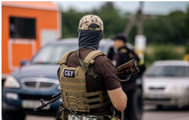
Фото: Замах на офіцера ССО в Одесі: СБУ затримала жінку

В Одесі жінка встановила "маячок" на авто офіцера ССО, щоб найманий кілер міг його вистежити і вбити. СБУ затримала агентку ФСБ просто після закладки пристрою.