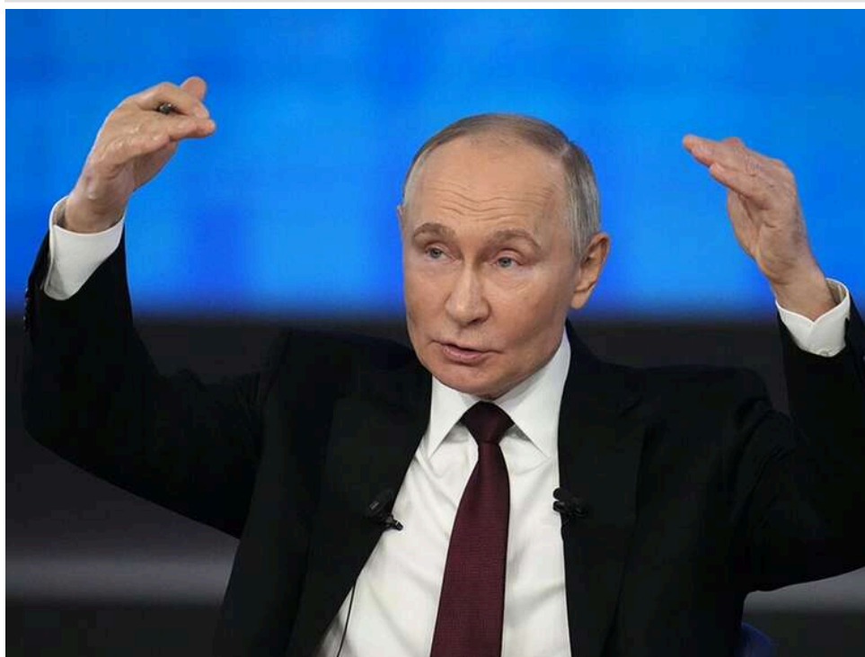
Мілітаризація перед виборами-2026: Кремль масово призначає учасників війни на керівні посади, – ISW

Кремль продовжує кампанію мілітаризації російського населення. Особливо активно ці зусилля спрямовуються напередодні виборів до Державної думи Росії, які відбудуться у вересні цього року.