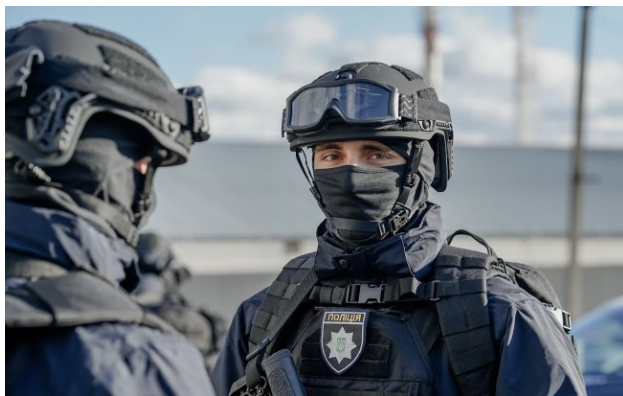
Фото: Організатор досі в розшуку: що відомо про масштабну операцію проти "Хімпрому"

Національна поліція України викрила одну з найбільших злочинних структур в країні - спільноту "Хімпром", яка роками торгувала наркотиками, замовляла напади на людей і ошукувала європейців.