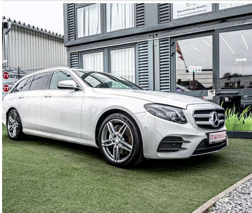
Кінець легенди: Mercedes-Benz може назавжди відмовитися від випуску універсалів

Автомобільний світ опинився на порозі кардинальних змін: легендарні універсали Mercedes-Benz ризують зникнути з ринку.