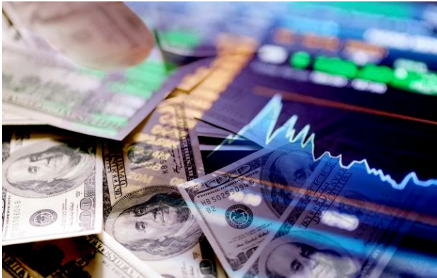
Фото: обмінники та банки оновили курс валют (Getty Images)

Після кількох днів зростання валютний ринок України продемонстрував розворот. У середу, 22 квітня, долар та євро почали втрачати в ціні.