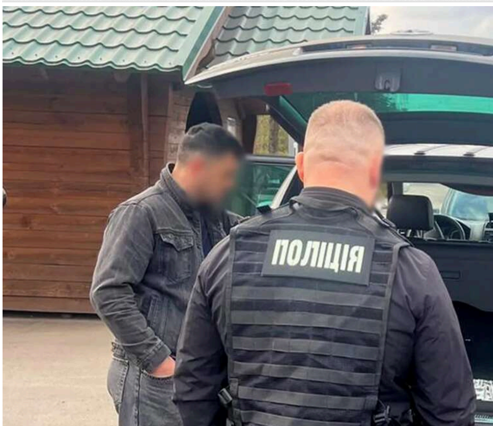
«Гуманітарка» на продаж: на Волині викрили псевдоблагодійників, які торгували автівками для ЗСУ

Про це повідомила Національна поліція України . У схемі задіяні представники благодійного сектору, які використали суспільну довіру та спрощені процедури ввезення гуманітарних вантажів для особистої вигоди.