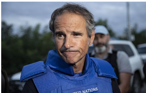
Фото: голова МАГАТЕ Рафаель Гроссі

Будь-яка ядерна угода між США та Іраном перетвориться на "ілюзію", якщо до процесу не залучать міжнародних інспекторів. Без жорсткого контролю обіцянки Тегерана не мають жодної ваги.