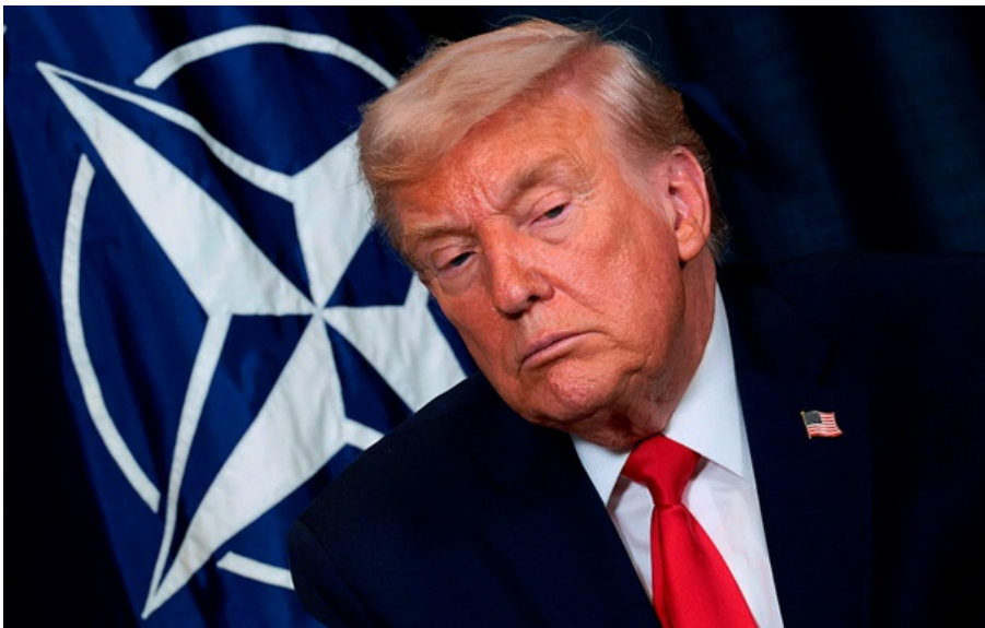
Президент США Дональд Трамп