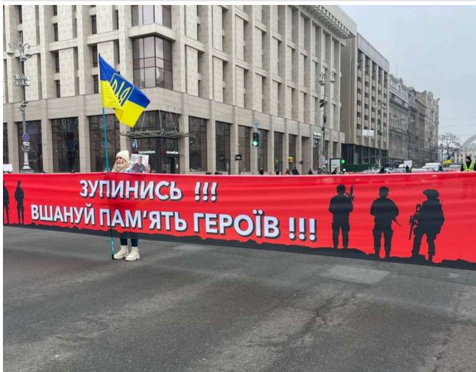
Хвилина мовчання на весь Київ: пам'ять полеглих тепер щодня вшановуватимуть через 400 точок оповіщення

У Києві хвилину мовчання щодня о 9:00 оголошуватимуть через гучномовці системи оповіщення. У місті вже працює понад 400 точок оповіщення.