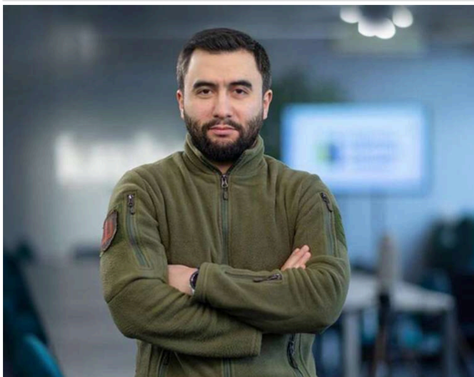
«Чорні списки» чи корупційна каса: Чому прості рішення не зупинять постачальників на кшталт Глиняної