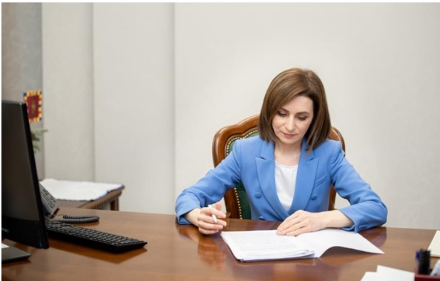
Мая Санду денонсувала основоположні угоди СНД

Цей крок є логічним продовженням курсу на європейську інтеграцію Молдови, зазначили в Кишиневі.