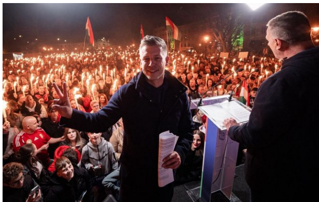
Фото: майбутній прем'єр Угорщини Петер Мадяр (Facebook/Петер Мадяр)

Виступаючи перед журналістами в Будапешті, майбутній прем'єр Угорщини Петер Мадяр заявив, що його колега - ізраїльський прем'єр Бен'ямін Нетаньягу - може бути заарештований у цій країні. Все через рішення Міжнародного кримінального суду.