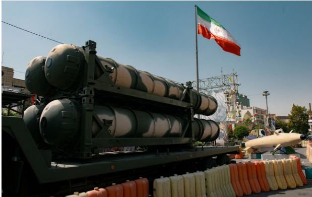
Фото: виставка ракетної зброї Ірану

Іранська армія зберегла значну частину своєї вогневої потужності навіть після тижнів масованих бомбардувань з боку США та Ізраїлю. В арсеналі Тегерана досі залишаються тисячі ракет та ударних безпілотників.